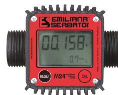
Contador de litros digital mod. M24, para gasóleo

Para gasóleo y gasolina. Absorción de agua y filtración de impurezas. Capacidad de filtración 10µm. Caudal 70 l/min.