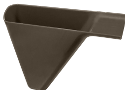
Bandeja colectora de goteo