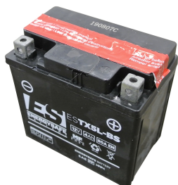
Batería de plomo con cargador de batería (enchufe europeo tipo C)