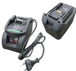
Batería de manganeso de 12 V o 24V con cargador de batería (enchufe europeo tipo C) y ranura para batería