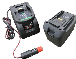
Batería de manganeso de 12V o 24V con cargador de batería (toma de mechero) y alojamiento de batería