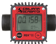
Contador de litros digital mod. M24, para gasóleo