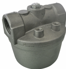
Filtro de red de acero INOX

Para gasóleo y gasolina. Filtración de impurezas. Capacidad de filtración 60µm. Caudal 50 l/min.